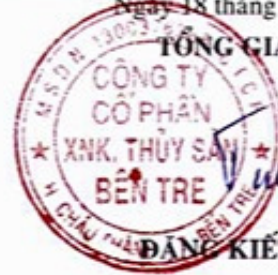
ĐẶNG KIẾT TƯỜNG